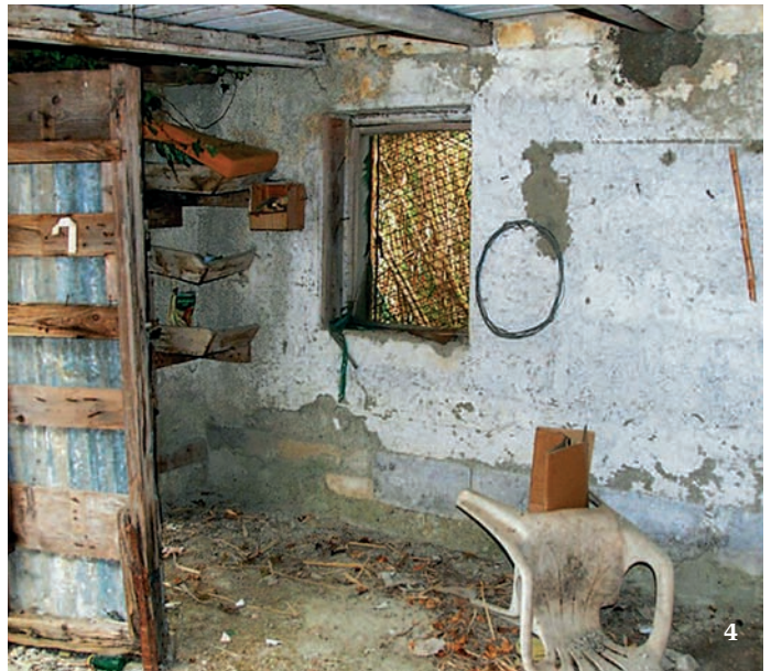
1 až 4 Ukázka rozmanitosti stanovišť, kde se štíři rodu Euscorpium mohou běžně vyskytovat. Prosluněné strání s vegetací (obr. 1), přímořské oblasti (2), kamenné zidky (3, foto F. Kovařík) nebo opuštěná lidská obydlí (4, foto F. Kovařík) 5 Příklady morfologicky výrazně odlišných druhů rodu Euscorpium . Zleva E. italicus , E. flavicaudis a E. germanus . Měřítko značí 1 cm. 6 Další příklad různých biotopů vyhledávaných evropskými druhy štírů představují zalesněná humidní stanoviště. Snímky J. Plíškové, pokud není uvedeno jinak