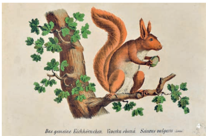
Das gemeine Eichhörnchen. Veverka obecná. Sciurus vulgaris Linné