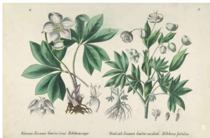
Sibonaca Susowati Gmelin (Cinn. Helleborus niger )