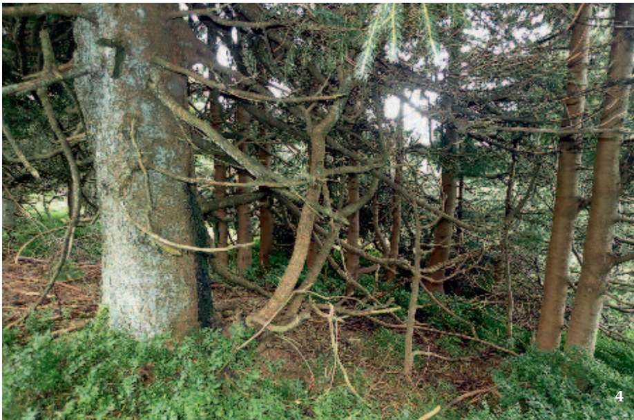
4 Kmen rodičovského stromu (vlevo) a odrostlí hříženci první generace

5 Typicky zbytnělá část kořenového náběhu u hřížence s pozůstatkem spojovací větve. Tento jedinec se již plně osamostatnil, protože došlo k přerušení spojovací větve.