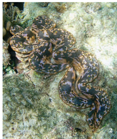
1 a 2 Zévy velké ( Tridacna maxima ) téměř celé zanořené do vápencového korálového podkladu. Ostrovy Lakadivy ležící severně od Maledív v Indickém oceánu

zjevně u zévu nedochází. V r. 2014 vědci přišli na to, že iridocyty jsou důležité právě pro zmiňované zooxantely (Holt a kol. 2014). Lámou sluneční světlo směrem dovnitř do hloubky plášťové tkáně a zvyšují tak přísun fotosynteticky důležitého záření symbiotickým řasám. Ty pak nemusejí být rozprostřeny jen na povrchu těla, kde je dostatek slunečního záření, ale mohou se vyskytovat i hlouběji v plášti, což se skutečně potvrdilo. Řasy jsou zde uspořádány