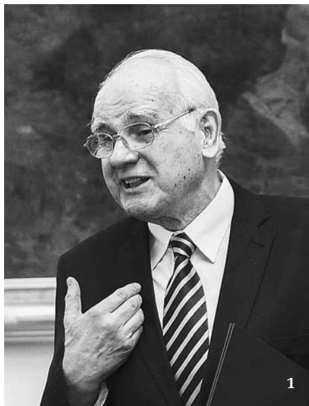
1 Bohuslav Ošťádal při udílení medaili Akademie věd ČR vědeckým osobnostem.

Bohuslav Ošťádal (*1940) vystudoval Fakultu dětského lékařství Univerzity Karlovy v Praze, kde se již během studia začal věnovat vědeckému výzkumu. Od r. 1966 pracuje ve Fyziologickém ústavu Akademie věd, prakticky od začátku ve funkci vedoucího Oddělení vývojové kardiologie, v letech 1990–95 jako ředitel ústavu. Ve své vědecké práci se zabývá především otázkami ontogenetického vývoje srdce a koronární cirkulace z hlediska funkčních změn, citlivosti k léčivům, odolnosti k ischemickému poškození či pozdních důsledků působení rizikových faktorů v časných fázích vývoje, zejména s ohledem na pohlavní rozdíly. Jeho čtené práce patří v této oblasti k prioritním, dosáhly značného mezinárodního uznání a jsou bohatě citovány.