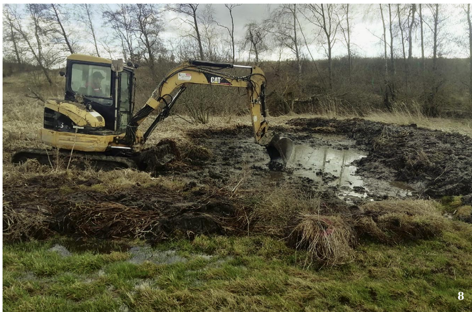
8 Budování nové tůně u Opatova. Terénní práce by měly probíhat mimo vegetační sezonu.

Za zmínku stojí také přírodní rezervace Na Podlesích nedaleko Opatova. Na ploše téměř dvou hektarů se zde vyskytuje řada ohrožených organismů. Lokalita se každoročně kosí a zbavuje náletových dřevin. Dříve zde žila kuňka obecná, postupně však došlo k zazemnění několika drobných tůň a místní populace kuňky zanikla. V r. 2019 byly tůně obnoveny, v současnosti je zaznamenán výskyt skokana zeleného a s. krátkonohého v počtech desítek jedinců. Rovněž byl v letních měsících pozorován výskyt desítek juvenilních jedinců ropuchy obecné. V letošním roce bude třeba tůně kvůli silnému zarůstání rákosinami zrevitalizovat.