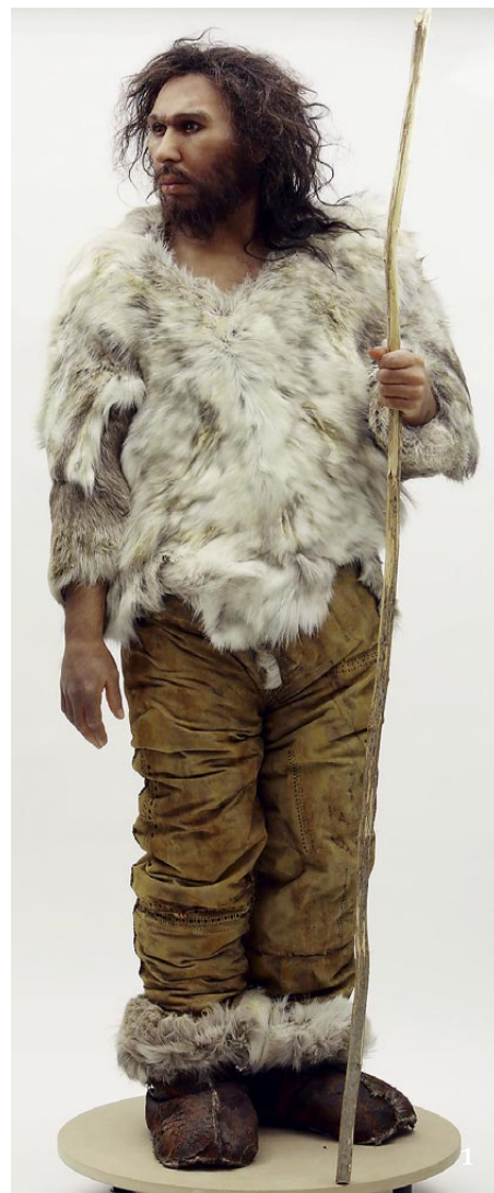
1 Umělecká rekonstrukce postavy muže z Předmostí na Moravě od Elisabeth Daynes.

Tělesné jádro dospělého člověka má teplotu kolem 37 °C. Jakmile teplota klesne pod 35 °C, začne hypotermie a při poklesu pod 29 °C nastává smrt. Vystavení chladu může také způsobit lokalizované poranění tkáně, nejznámější jsou omrzliny, při kterých zmrazení tkáňových tekutin vede k trvalému poškození. Výsledkem je gangréna (odumřelá a dalšími vlivy druhotně změněná tkáň, viz obr. 6), pokud není postižená oblast zahřata a cirkulace obnove-